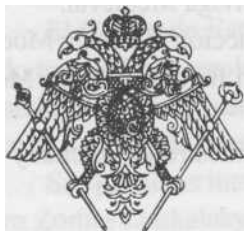
Centro de Estudios Bizantinos y Neohelénicos «FOTIOS MALLEROS».