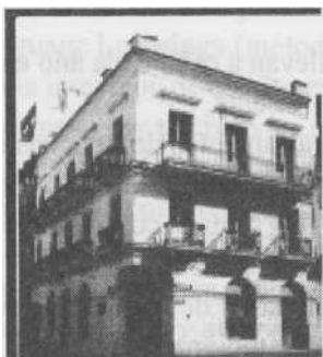
Sede de la Fundación Tsakos, en Montevideo

Así, se constituyó en 1978 la Fundación Tsakos, una asociación civil sin fines lucrativos, que ha tenido como objetivo fundamental la difusión de la Cultura Helénica en Uruguay, haciendo especial hincapié en la enseñanza del Griego Moderno.